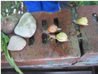
Kinder beobachten ein Schneckenrennen.

Zur Freiheit gehört die Verantwortung anderen gegenüber. Beides ist nach christlichem Verständnis untrennbar miteinander verbunden.