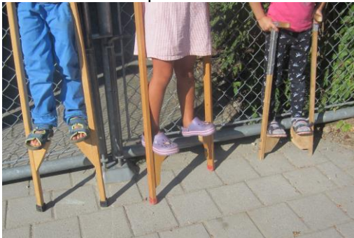
Eine Vorschulaufgabe ist es, das Laufen mit Stelzen zu lernen.

In ihren Vorschulmappen erledigen die Kinder Woche für Woche möglichst selbständig ihre Aufgaben, die die verschiedensten Bereiche, wie Bewegung, Singen, Experimente, Sprache, Mathematik etc., abdecken. Dabei planen sie ihre Arbeitsschritte und die benötigte Zeit zunehmend selbständiger.