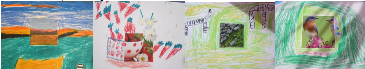
Kreative Aufgabe in der altershomogenen Gruppe

Im zweiten Jahr können die Kinder auf der Basis der bereits gewonnenen Sicherheit ihren Wirkungskreis erweitern. In der altershomogenen Gruppe (einmal in der Woche im Stuhlkreis) finden differenziertere und komplexere Angebote statt.