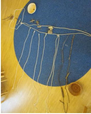
Heuschrecke, von Kindern gestaltet aus Seilen und Naturmaterialien

Sie haben auch die Möglichkeit, in einen Kreativraum/Werkraum zu gehen und mit Hammer und Säge zu arbeiten. Die Entwicklung der Kreativität wird auch durch die spielzeugfreie Zeit gefördert, die in zwei- bis dreijährigem Abstand stattfindet und mehrere Wochen im Sommer dauert.