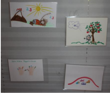
Symbole für Finger-/ Kreisspiele (Oben auf dem Berge, Zot telzaum und Apfelbaum, zehn kleine Zappelmänner, Schuhsalat)

Dieses Angebot findet erst einige Wochen nach dem Start im September statt, um die Kinder in ihrer Kerngruppe ankommen zu lassen. Die Kinder, die schon länger im Kindergarten sind, übernehmen Patenschaften für die neuen Kinder. Sie unterstützen die neuen Kinder beim Ankommen und in ihrer Selbständigkeitsentwicklung durch Hilfestellung und ihre Vorbildfunktion.