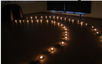
Wir empfinden den Weg von Maria und Josef zur Krippe nach.

Schöne Geheimnisse gibt es viele bei uns im Kindergarten.